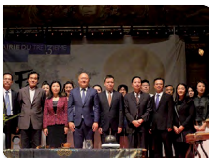
Fête de la Lune à la mairie du 13 ème