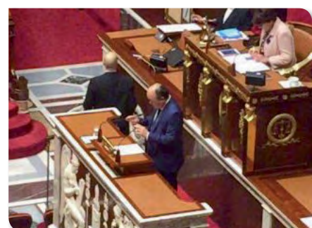
Présentation de mon rapport sur le commerce extérieur pour le budget 2019