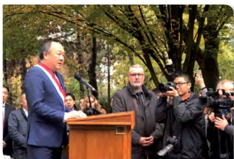
Centenaire de la 1 ère guerre mondiale : hommage aux 140 000 travailleurs chinois