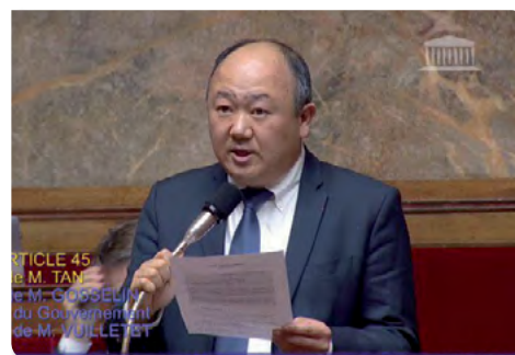
Défense de mes amendements pour le projet de loi Justice