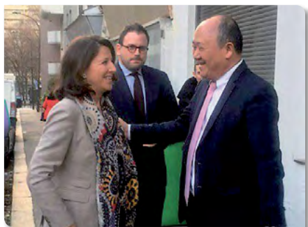
Accueil d'Agnès BUZYN, Ministre de la Santé dans le 13 ème