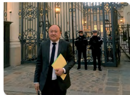
RDV au Ministère de l'Intérieur sur la sécurité du 13 ème