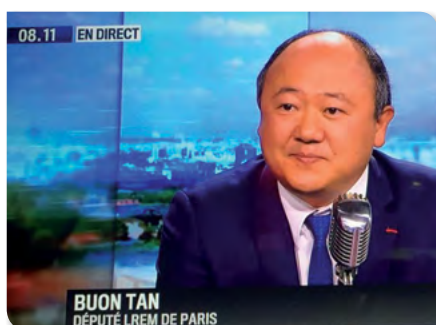
Interview suite à ma tribune sur l'ouverture des commerces le dimanche