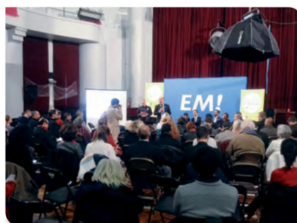
Réunion publique sur l'autisme dans le 13 ème