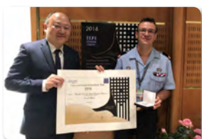
MAI 2018 Remise des prix du concours Lépine pour un inventeur du 13 ème