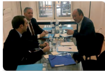
NOVEMBRE 2017 Rencontre avec le cabinet de Gérard Collomb sur la sécurité du 13 ème