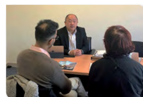
JANVIER 2018 Rendez-vous avec les habitants à ma permanence