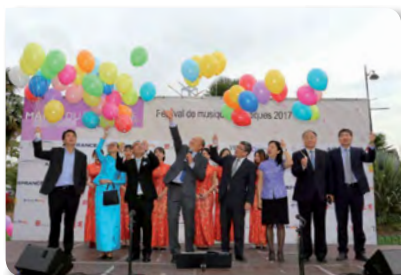
SEPTEMBRE 2017 La Fête de la Lune à la mairie du 13 ème