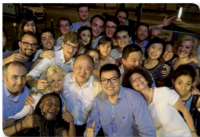
JUN 2017 Un grand bravo aux marcheurs pour leur engagement !