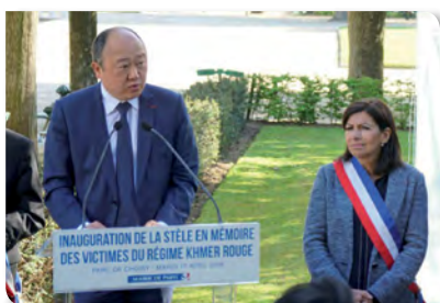
AVRIL 2018 Inauguration de la stèle en mémoire des victimes du régime khmer rouge