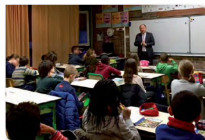
JANVIER 2018 Visite de l'école élémentaire Dunois