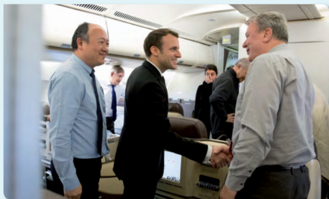
(Avec le Président lors de son voyage officiel en Chine en janvier dernier)