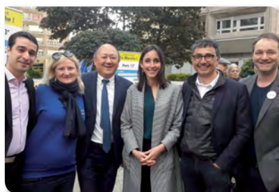
MAI 2018 Grande marche pour l'Europe dans le 13 ème avec Brune Poirson